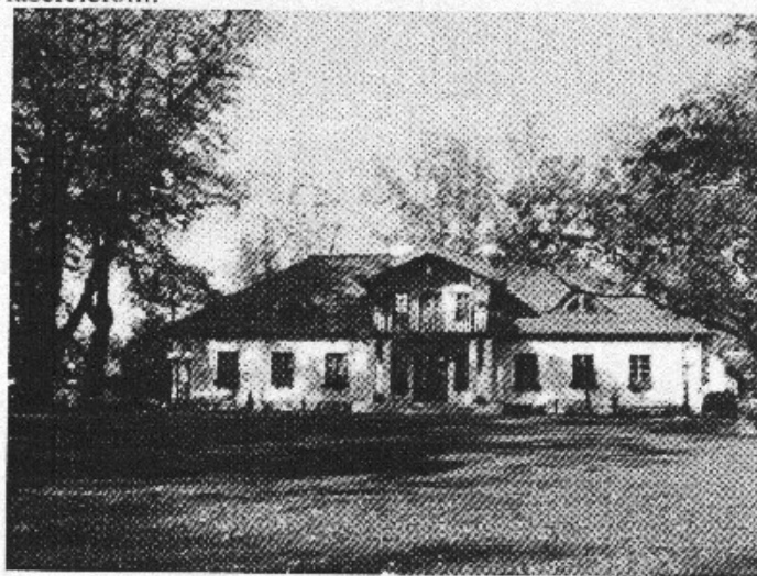
Obecny wygląd dworku w Kruszowie